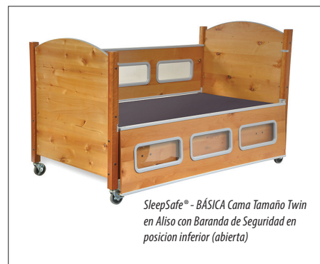
SleepSafe® - BÁSICA Cama Tamaño Twin en Aliso con Baranda de Seguridad en posición inferior (abierta)