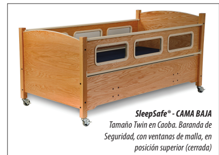
SleepSafe® - CAMA BAJA Tamaño Twin en Caoba. Baranda de Seguridad, con ventanas de malla, en posición superior (cerrada)

Acolchado encima o alrededor de las ventanas (6 colores disponibles); Ventanas transparentes Sólidas o de Malla; Poste IV; Orificio de Acceso al Canal de Entubación; Ventanas en la Cabecera y/o Piecera