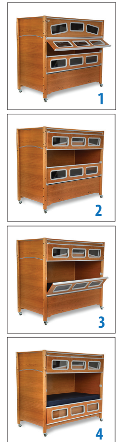
Secuencia de apertura de la baranda de seguridad superior que se sujeta a la cama extendida SleepSafe® para un acceso más rápido y fácil.