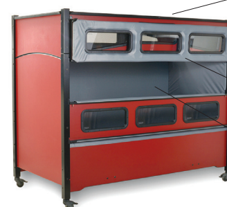
Acolchado (Opcional) La Cama está totalmente acolchada y se muestra aquí con acolchados alrededor de las ventanas.