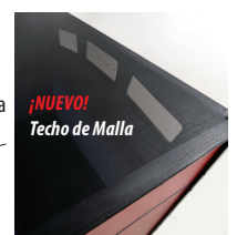
¡NUEVO! Techo de Malla